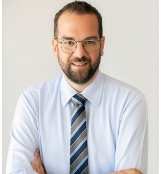
Νεκτάριος Φαρμάκης, Περιφερειάρχης Δυτικής Ελλάδας

Φέτος είναι μια σημαντική χρονιά για όλους τους Έλληνες καθώς συμπληρώνονται 200 χρόνια από την έναρξη της Ελληνικής Επανάστασης. Για το λόγο αυτό, επιλέξαμε την περιοχή των Καλαβρύτων για τη φιλοξενία της εκδήλωσης ως ελάχιστο φόρο τιμής στους προγόνους μας που με τους αγώνες και τις θυσίες τους είμαστε σήμερα ελεύθεροι και κοιτάζουμε το αύριο με αποφασιστικότητα και αισιοδοξία.