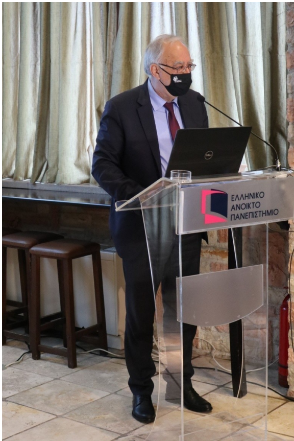
Αθανάσιος Παπαδόπουλος, Δήμαρχος Καλαβρύτων