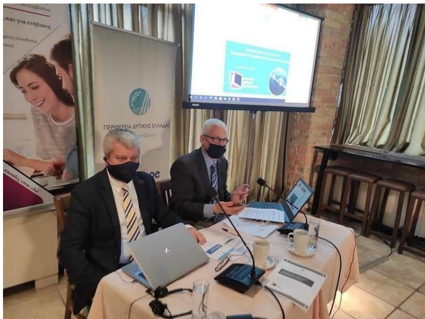
Ιωάννης Καλαβρουζιώτης, Πρόεδρος ΠΣΕΚ, Π.Δ.Ε Φωκίων Ζαΐμης, Αντιπεριφερειάρχης Επιχειρηματικότητας, Έρευνας και Καινοτομίας, Π.Δ.Ε.